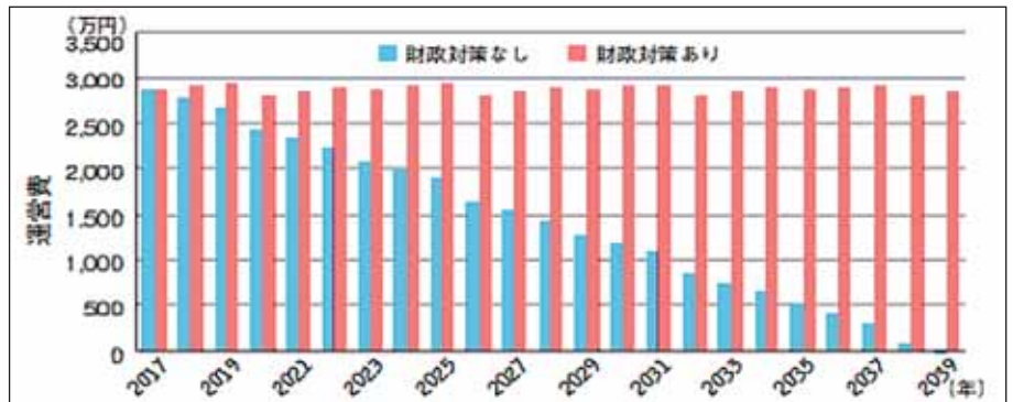
表 財政対策のあり・なしによる運営費の推移

本件につきまして、ご意見がございましたら事務局(sousuikai@uitech.ac.jp)までご連絡ください。