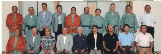
滄水会中国・四国支部懇親会

NHK大河ドラマ「花燃ゆ」の舞台にもなった山口県の湯田温泉ユウベルホテル松政にて中国・四国訓大OB滄水会が、19名の参加者が集まり開催されました。各地域の活動等の情報交換が行われ、楽しいひとときとなりました。