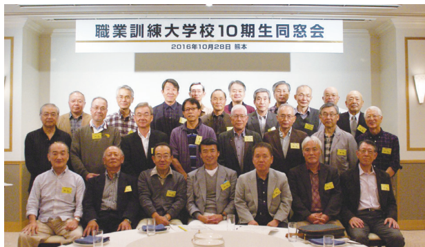
訓大10期生同窓会(in熊本)

今年で65歳を迎える節目の年、また熊本地震の復興支援ということもあり、九州で開催しようと全国から26名の方が集まり、昼はゴルフ大会、夜には宴会そして翌日は旅行会と大いに盛り上がりました。43年ぶりに会う人などもいて、本当に懐かしいひと時を過ごすことができました。最後に、次の開催については3年後にやろうと参加者みんな確認をしてしばしの別れをすることとなりました。今回は全員に連絡が行き届かない部分もありましたので、次回はより多くの方にお声掛けをしたいと考えています。