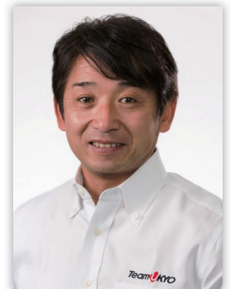
片山 右京 氏